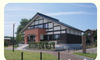
北越戊辰戦争伝承館