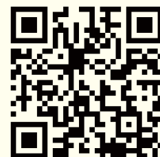
長岡グランドホテル HPのアクセス案内