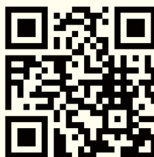
ハイブ長岡HPの アクセス案内

※本大会では、宿泊施設の斡旋は行いません。懇親会会場・2日目の出発場所となる「長岡グランドホテル」および近隣の宿泊施設を各自でご確認の上、ご手配ください。